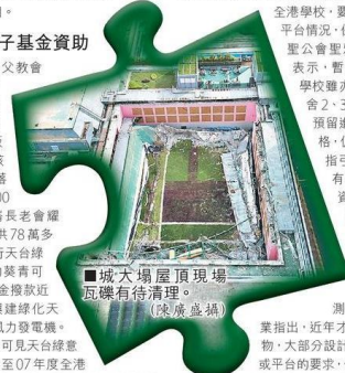
本港多間大專及中小學，均有不同程度的天台綠化設施。

測量師學會前會長何炬業指出，近年才落成的新校舍或建築物，大部分設計都負荷到綠化天台或平台的要求，但對於一些舊校舍，如由學生自行在天台堆砌的苗圃，則會增加負載能力及危險性。何又稱，如所使用的磚頭是可隨意移動，則不被視為建築工程，但如使用了混凝土或永久固定防水層，已涉及建築工程，需要有關專業人士監督，但可能因學校和學生熱心綠化，卻沒有考慮周全，產生危機而不自知。