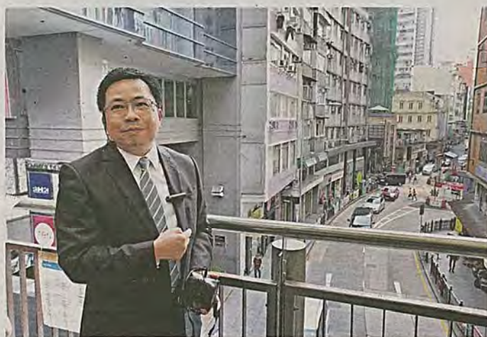
踏上全港最長的電梯到堅道的天橋路段，便會發現新樓與舊樓一左一右，而且舊樓有慢慢「讓路」發展之勢，叫人感慨。

雖這樣說，測量師重實效卻不勢利。何會長走過中環街市和舊樓，就指社會發展不一定要拆舊樓。一些舊建築如中環街市，基於其文化和歷史價值，很值得保留，「如能保育和活化，就能突顯其價值」。說著說著，提到中區電車去留與否，何會長也直言不應廢除電車，因每日仍有不少市民需要搭電車，而且電車行駛百年具文化價值，絕對值得保留。