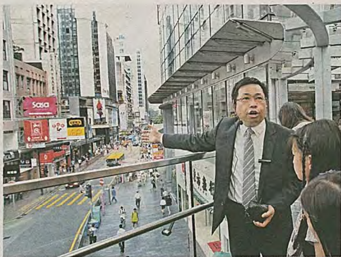
走在中環的天橋系統，便可悠閒地感受這個金融中心四周的活力與急速的節奏。