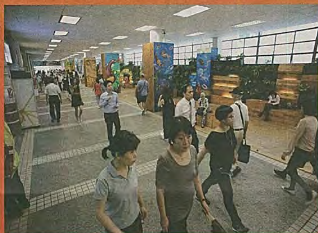
由恒生總行通往中環街市的天橋，一出一入之別就在政府的建設沒有冷氣。