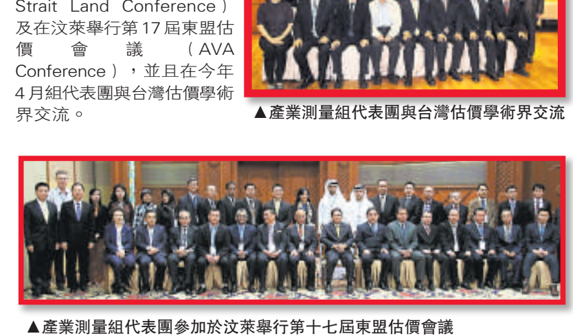
▲ 產業測量組代表團參加於汶萊舉行的第十七屆東盟估價會議

此外，香港測量師學會產業測量組積極參與相關的國際會議或與外地專業團體作定期交流。今年5月，產業測量組派出代表參加國際測量師聯合會國際會議（FIG），7月第7屆兩岸四地土地學術研討會（The 7th Cross Strait Land Conference）及在汶萊舉行的第17屆東盟估價會議（AVA Conference），並且在今年4月組代表團與台灣估價學術界交流。