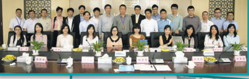
▲ 青年組武漢交流學習

展望將來，我們會繼續鼓勵所有青年組會員和學生，通過學習新技能以增強優勢及提升競爭力，並盡力滿足青年組會員的創新和有創意的文化，亦希望資深會員繼續大力支持，幫助發掘年輕會員的潛能。