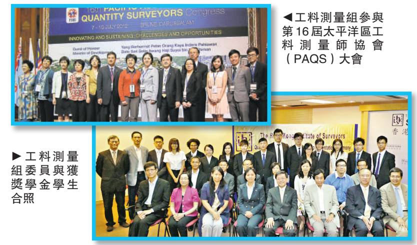
▲ 工料測量組參與第16屆太平洋區工料測量師協會（PAQS）大會

此外，今年本組別繼續連同多間工料測量顧問公司設立獎學金，今屆共有15名學生獲獎，頒獎禮已於本年8月28日舉行。 建築信息模型（BIM）是一個重要的技術，它的應用程序是一個必然趨勢。有見及此，工料測量組於今年成立一個BIM小組委員會去探討這方面的技術。初步目標為：1) 保持會員了解BIM最新的發展和應用；2) 安排BIM研討會和工作坊；和3) 安排排班不同的機構分享他們對BIM的經驗。小組委員會將首先集中於宣傳和教育，並逐漸將焦點放在如何充分發揮BIM的最大潛力及應用在工料測量行業。