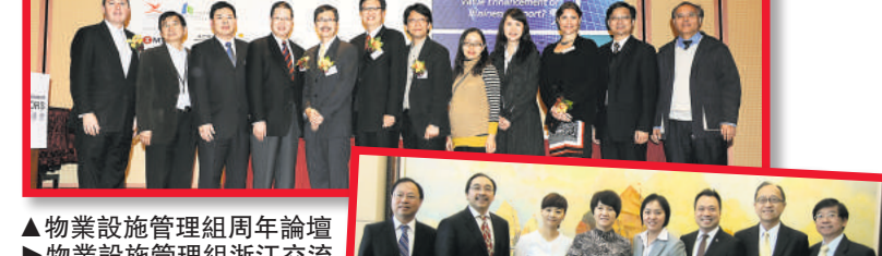
▲ 物業設施管理組周年論壇

另一方面，物業設施管理組大力支持由香港綠色建築議會與環保建築專業議會合辦的「環保建築大獎2012—實踐零碳」，提倡於現有的建築物廣泛及有效地採用環保設施管理方案，以達致可持續性發展之建築的環境，提高同業及公眾對可持續性發展環境的關注。