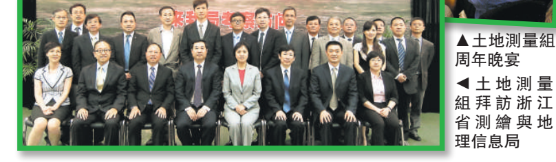
▲ 土地測量組周年晚宴

我們也積極參與專業資格互認的工作，與有關海外組織訂立了資格互認協議。為了在內地加強發展，我們關注內地的註冊測繪制度的發展。為實施內地與香港專業資格互認、註冊及執業作好準備。今年，土地測量組舉辦了多次考察團，包括國際測量師聯合會工作會議、數據處理和地理空間信息聯合國際會議、國際攝影測量與遙感學會會議等。