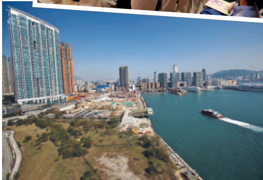
▲香港測量師的工作涉及範疇廣泛，從土地發展到興建樓宇及物業管理都有涉獵。(資料圖片)